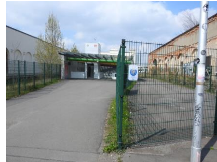
Station 1: Bayerischer Bahnhof

Im Hörspaziergang werden einige dieser naturschutzfachlichen Themen und Problemfälle vorgestellt und die Hörerinnen und Hörer werden zum Mitmachen aufgerufen.