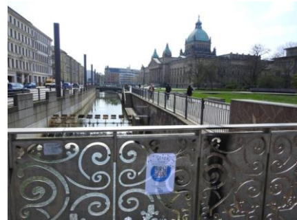
Station 6: Bundesverwaltungsgericht