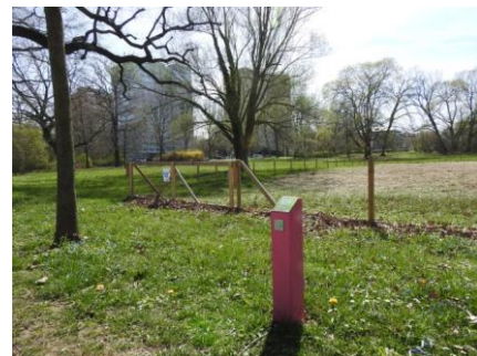
Station 7: Johannapark