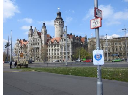
Station 5: Rathaus

Treffpunkt: Artenschutzurm nahe Schulcampus Ihmelstraße / Ecke Edlichstraße, Leipzig-Sellerhausen