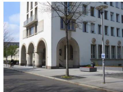
Station 3: Uniklinikum