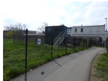
Station 2: Portikus